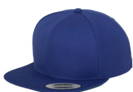
kongeblå/ grønn underside brem