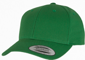
CURVED CLASSIC SNAPBACK