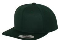
flaskegrønn/ grønn underside brem