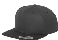
mørk grå/ mørk grå