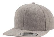
lys gråmelert/ lys gråmelert