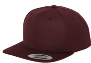
maroon/ grønn underside brem