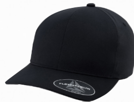
FLEXFIT DELTA ADJUSTABLE