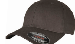
mørk grå/mørk grå