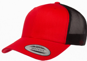
YP CLASSICS® RETRO TRUCKER CAP 2-TONE