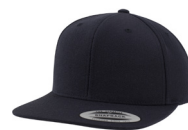
mørk marine/ mørk marine