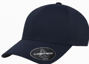
FLEXFIT DELTA SNAPBACK