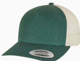
YP CLASSICS® 5-PANEL RETRO TRUCKER CAP - 2-TONE