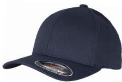
mørk marine/ mørk marine