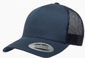
YP CLASSICS® 5-PANEL RETRO TRUCKER CAP