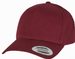
5-PANEL CURVED CLASSIC SNAPBACK