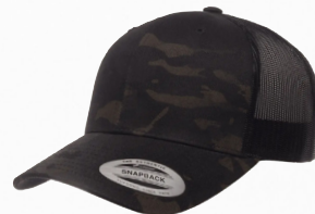
RETRO TRUCKER MULTICAM®